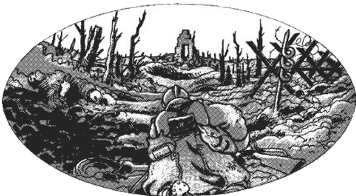
Beeld uit 'Loopgravenoorlog' van Jacques Tardi.