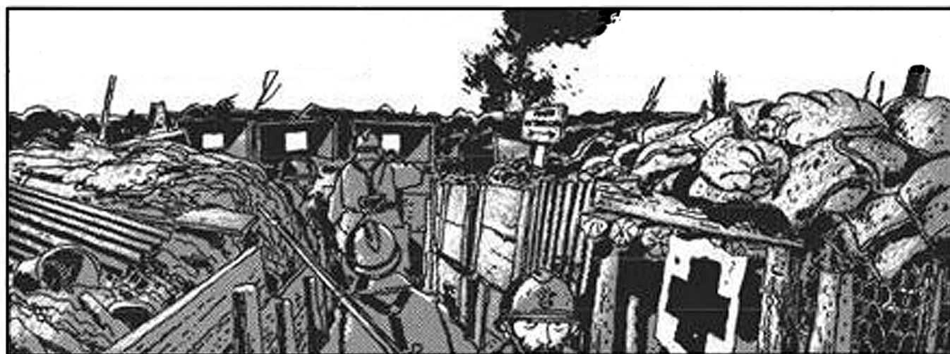
Beeld uit 'Loopgravenoorlog' van Jacques Tardi.